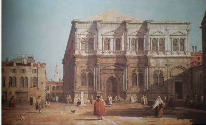
Canaletto Scuola Grande di San Rocco, 1730. Collezione privata Woburn Abbey, (part.)