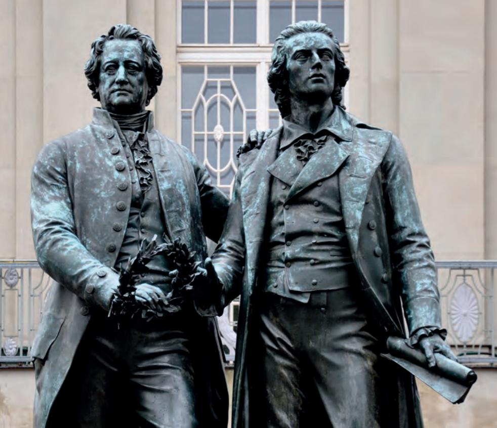
Monumento di Goethe e Schiller a Weimar (DE)

Stefano Zecchi è stato professore ordinario di Filosofia nell'Università degli Studi di Padova e di Estetica nell'Università degli Studi di Milano, docente in numerosi atenei stranieri, tra cui quello che più gli è rimasto nel cuore è l'Università Tagore di Calcutta, in India. Oltre all'insegnamento, ha ricoperto importanti incarichi amministrativi: Presidente dell'Accademia di belle Arti di Brera, rappresentante del Ministero della Pubblica Istruzione presso l'UNESCO per la tutela dei beni immateriali, membro del consiglio dell'Irer (Istituto per la programmazione scientifica e culturale della Regione Lombardia), consigliere d'amministrazione del Piccolo Teatro di Milano, della Fondazione La Verdi di Milano, del Teatro Parenti di Milano, del MAXXI (Museo dell'arte del XXI secolo) di Roma.