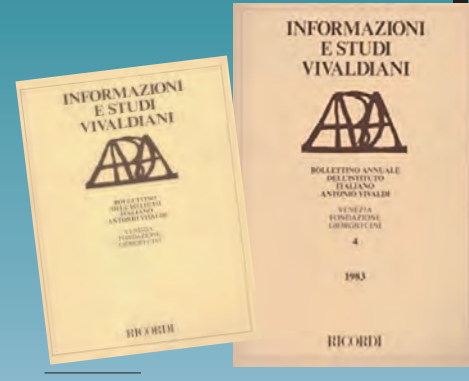
Informazioni e Studi Vivaldiani dell'Istituto Antonio Vivaldi