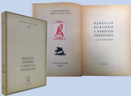
I testi, rivisti e completati, delle lezioni tenute nei Corsi Internazionali di Alta Cultura