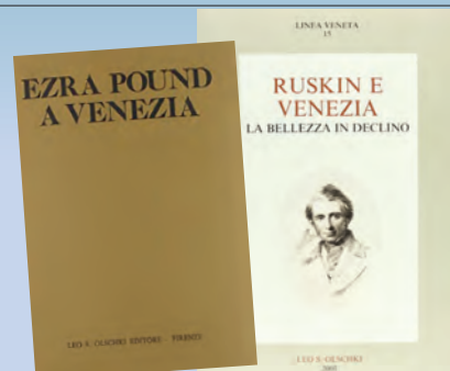
Linea Veneta (dal 1980). I massimi esponenti della cultura mondiale