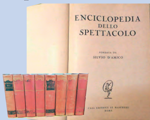
L'enciclopedia dello spettacolo