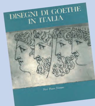
Catalogo della Mostra "Disegni di Goethe in Italia" del 1977