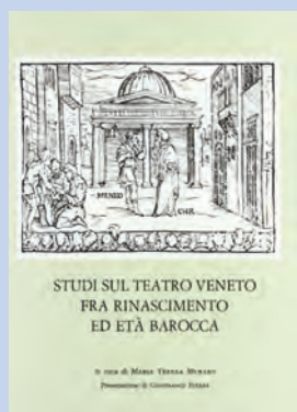
I testi, rivisti e completati, dei Corsi Internazionali di Storia del Teatro