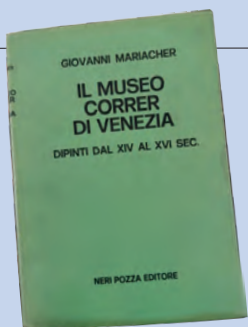
Nel 1957, poco dopo la costituzione dell'Istituto di Storia dell'Arte, si avvia questa collana dedicata ai musei veneti