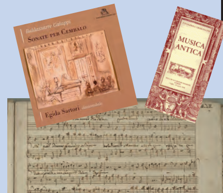
Seminari di Musica Antica