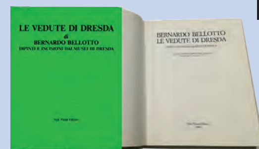
Catalogo della Mostra "Bernardo Bellotto. Le vedute di Dresda. Dipinti e incisioni dai Musei di Dresda," del 1986