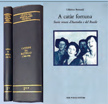
Cultura Popolare Veneta in collaborazione con la Regione del Veneto