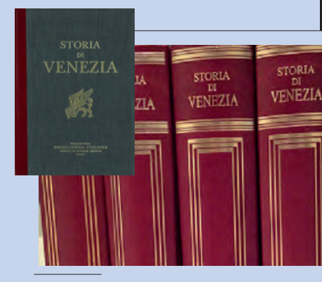
Storia di Venezia dell'Istituto dell'Enciclopedia Italiana