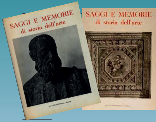
Saggi e memorie di Storia dell'Arte dell'Istituto di Storia dell'Arte