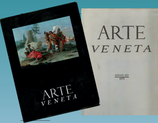
Arte Veneta dell'Istituto di Storia dell'Arte