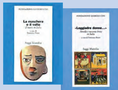
I testi, rivisti e completati, delle lezioni tenute nei Corsi per Italianisti