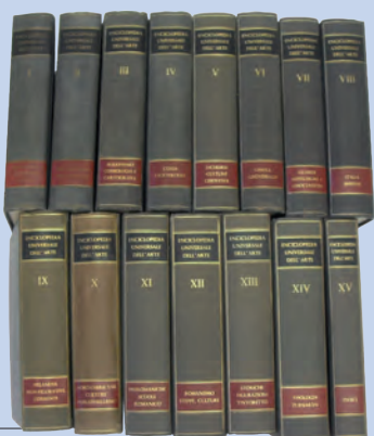
L'enciclopedia Universale dell'Arte