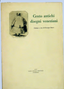
Catalogo della Mostra "Cento Antichi Disegni veneziani" del 1955