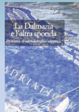
Convegni e atti sui rapporti con Ungheria, Polonia, Russia, Cecoslovacchia e altri paesi dell'Est Europa