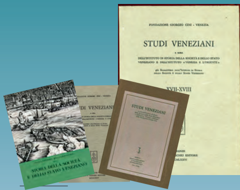
Studi Veneziani dell'Istituto di Storia della Società e dello Stato veneziano