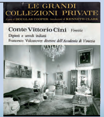
Alcune opere della collezione in uno dei salotti del Palazzo di San Vio