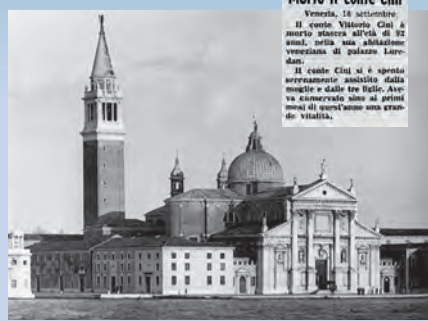
I funerali di Vittorio Cini sono celebrati nella Basilica di San Giorgio Maggiore