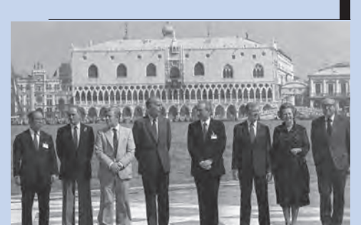
I rappresentanti del vertice del G7 sul sagrato di San Giorgio Maggiore