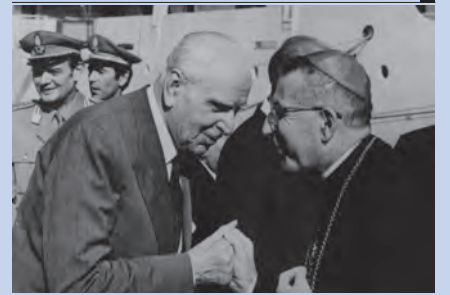
Vittorio Cini accompagna il Patriarca di Venezia, Albino Luciani, in visita a San Giorgio