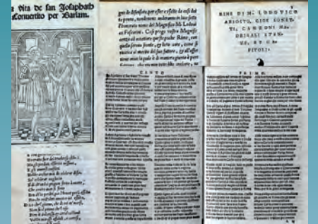
Tavola rotonda "Il libro nella Civiltà contemporanea"