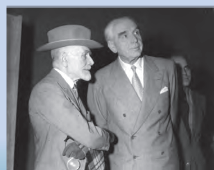
Vittorio Cini con Bernard Berenson in una foto degli anni '50