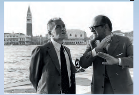
Pietro Ingrao e Vittore Branca a San Giorgio Maggiore