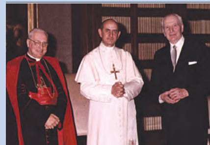
Papa Paolo VI riceve in udienza Vittorio Cini e il Patriarca di Venezia Giovanni Urbani