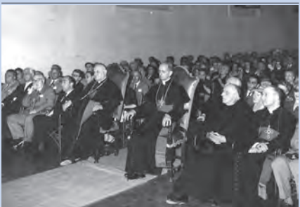
Il Patriarca di Venezia, Angelo Giuseppe Roncalli e l'Arcivescovo di Milano, Giovanni Battista Montini, nel Cenacolo Palladiano