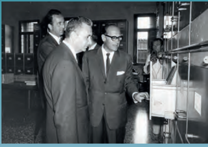
Il Ministro degli Affari Esteri, On. Aldo Moro, a San Giorgio, con Vittore Branca