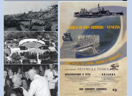
Teatro Verde: dalla costruzione all'inaugurazione e la locandina del primo spettacolo