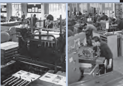
Le sezioni "grafici" e "meccanici" del Centro Arti e Mestieri, antesignano delle scuole professionali