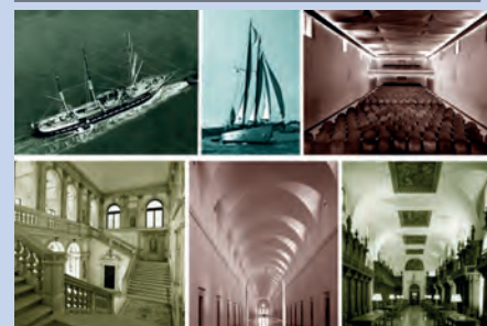
Le navi scuola, il Piccolo Teatro, lo Scalone e la Biblioteca del Longhena, la Manica Lunga