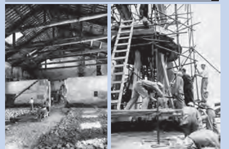
Lavori di restauro: edificio principale del futuro Centro Marinaro e cupolino della Chiesa