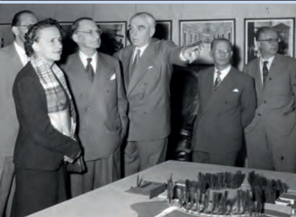
Vittorio Cini con il Presidente del Consiglio Alcide De Gasperi in visita alla Fondazione Giorgio Cini