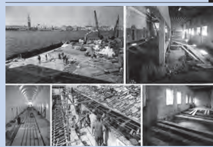
Gli imponenti lavori di restauro delle architetture e del parco dell'Isola tra il 1951 e il 1954