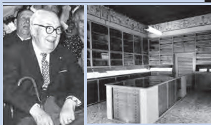
Il Centro di Cultura e Civiltà che propone manifestazioni del più alto livello culturale.