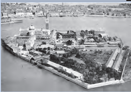
L'isola di San Giorgio Maggiore, dopo 150 anni di degrado, prima dell'inizio dei lavori di restauro