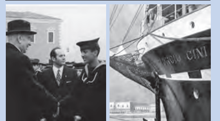
Il Centro Marinaro: Vittorio Cini incontra i marinaretti dell'Istituto Scilla e la nave scuola Giorgio Cini attraccata a San Giorgio