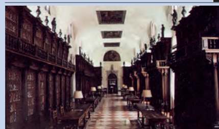
I 4 Istituti del Centro di Cultura e Civiltà: 1954 Storia dell'Arte, 1955 Storia della Società e dello Stato veneziano, 1957 Lettere, Musica e Teatro, 1958 Venezia e l'Oriente